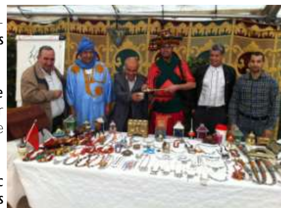
Les membres de l'Association Interculturelle Belgo-Marocaine (AIBM)

Une cinquantaine d'enfants a participé à ces activités et a pu découvrir les richesses de cette culture. En intégrant ces jeunes dans une dynamique interculturelle, notre Centre propose donc de lutter contre les préjugés pouvant être véhiculés par méconnaissance de l'autre.