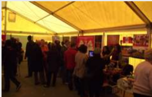
Le public, à la découverte des différentes spécialités

Quévy - Du 17 au 22 octobre Semaine de l'Égalité des Chances : animations dans les écoles et marché multiculturel