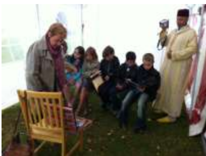
Les jeunes participants aux animations autour des valises interculturelles du CIMB

Notre Centre a plus particulièrement pris en charge, en collaboration avec la Direction générale des affaires culturelles de la Province de Hainaut, les animations liées aux animations de Valises interculturelles. Notre stand d'information a aussi été installé lors d'une après-midi destinée au grand-public.