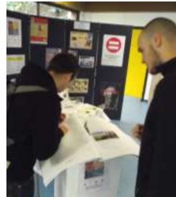
Des étudiants signant la charte pour la Démocratie contre toutes les exclusions du CIMB

Journée d'accueil des nouveaux étudiants de la Haute Ecole en Hainaut, 7 e édition le 21 septembre 2011