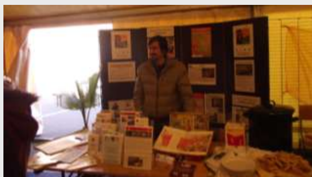
Une série d'informations thématiques étaient à la disposition du public sur le stand du CIMB